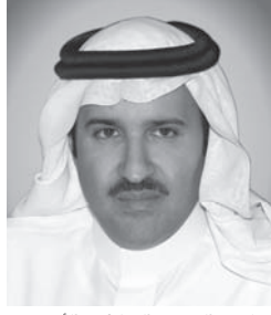
صاحب السمو الملكي الأمير فيصل بن سلمان بن عبد العزيز آل سعود (رئيس مجلس الإدارة)