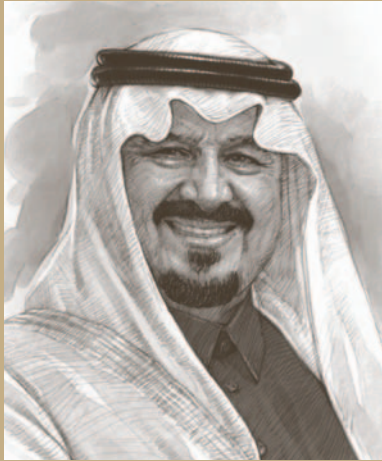
صاحب السمو الملكي الأمير سلطان بن عبد العزيز آل سعود ولي العهد ونائب رئيس مجلس الوزراء ووزير الدفاع والطيران والمفتش العام