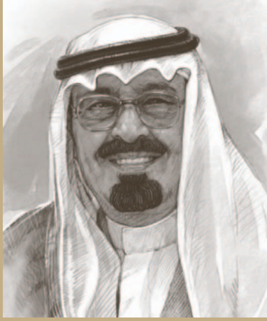
خادم الحرمين الشريفين الملك عبد الله بن عبد العزيز آل سعود